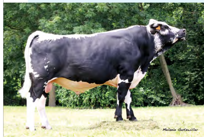
Ivanhoé sera indexé en juin notamment grâce aux 11 filles pointées cet automne.