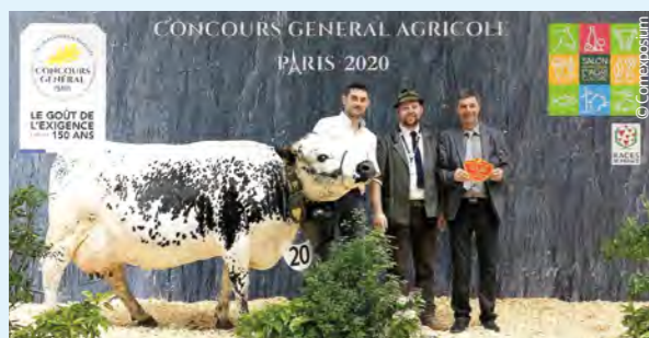
Meilleure Fromagère : ECLIPSE - Earl du Rothenbach. Elle illustre le lien indéfectible entre une vache, la Vosgienne, et un fromage, le Cœur de Massif