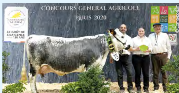
La consécration pour GIRLY, 1 ère de section des vaches confirmées et Grande Championne Concours Général Agricole! - SNC de l'Envers des Graviers. Mère-support du schéma laitier, pleine sœur du taureau Guerrier