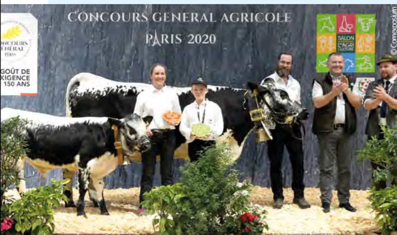
Championne Allaitante : FRATERNELLE - SCA du Frarupt. Un parcours mixte comme la race : vache laitière quelques années au Gaec de la Chapelle des Vés, elle intègre ensuite le cheptel allaitant de la famille Walter. Fraternelle est également mère support dans les schémas de sélection laitier et allaitant.

25 vaches Vosgiennes et 5 veaux ont foulé les tapis verts du Salon de l'Agriculture cette année, pour un concours « pas comme les autres ». En effet, pour célébrer 40 années de dynamisme de la Vosgienne, l'Organisme de Sélection a décidé d'accompagner les éleveurs et les vaches en concours par les 4 techniciens qui ont travaillé à leurs côtés, depuis le plan de relance en 1977 jusqu'à aujourd'hui.