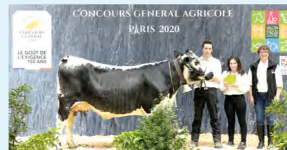
Triplé gagnant ! 1 re Vache Jeune, Ch. Jeune et Ch. Mamelle : LUMIERE - Gaec des Hautes Huttes. Mère-support dans le schéma de sélection, demi-sœur du taureau Jules.