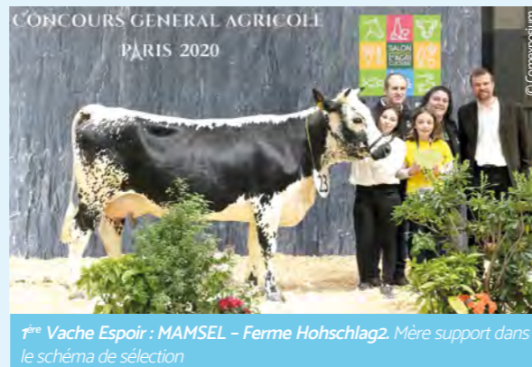
1 re Vache Espoir : MAMSEL - Ferme Hohschlag2. Mère support dans le schéma de sélection

« J'ai démarré au Herd-Book et j'ai fini à l'Organisme de Sélection. Les missions qui m'ont marqué ? La création de l'ISU pour la race, et le concours spécial de St Bresson en 2005 ».