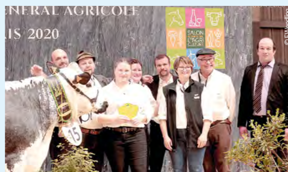
GIRLY bien entourée par les techniciens et le président de l'OS (et ses éleveurs !)